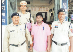
■ दुलदुला थाना क्षेत्र का सनसनीखेज मामला जशपुर पुलिस की बड़ी कार्रवाई, फरार आरोपी गिरफ्तार