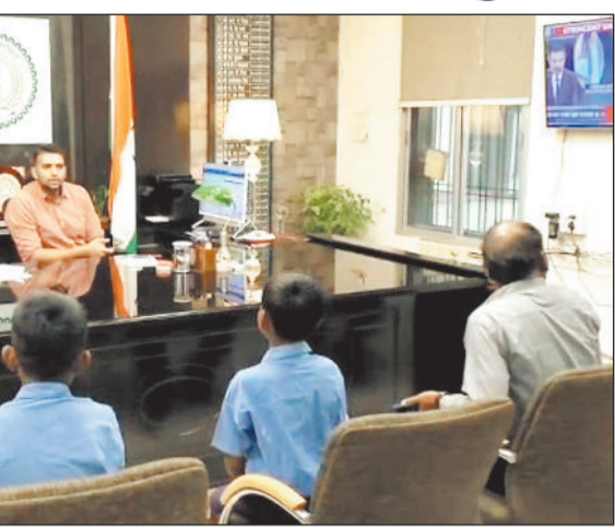
दोनों बाल वीरों की बहादुरी की प्रशंसा करते हुए कलेक्टर ने दोनों बच्चों को साहसिक उपचार दिया, जिससे उनकी जान बच गई।